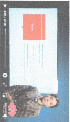
Т.Гүлдаурен Сүүлийн үндсэн буюу ХИЧЭЭЛ НЭЭЭ ТООДУУ МАТТЕРС Хамгийн чухал цаг хугацаа бол ӨНГӨРСӨН БИШ ИРЭЭЛЭЙ БИШ ХЭРИН ӨНӨӨДӨР ЮМ. ӨНӨӨДӨӨР АМЬСЭЭВЭЙН ТААВАР ХАГИЙН ЧУХАЛ ҮЙЛЧИЙГ ТААХН БОЛГОНО УУ Миний 20 ичээлээр хамт байсан 19 бүхэндээ маш их саярлалаа